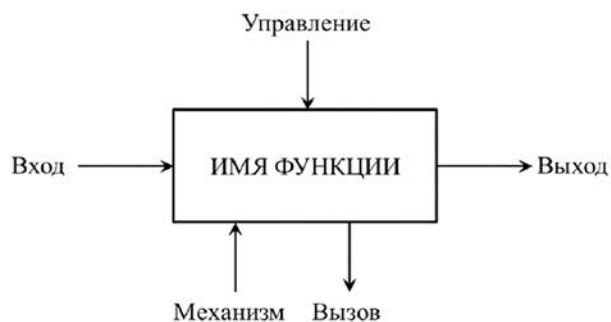
Рис. 1. Базовые параметры функционального моделирования в методологии IDEF0

Анализ модели «войн памяти» выполнен на примере попыток искажения исторической памяти белорусского общества в отношении такого исторического события, как Великая Отечественная война.