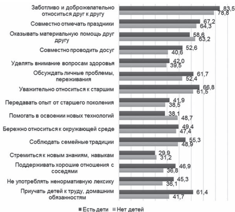
Рис. 2. Распределение ответов на вопрос: «Что из нижеперечисленного принято в Вашей семье?» среди белорусов в зависимости от наличия детей, %

Выделяются 61,4 % респондентов, которые непосредственно в процессе воспитания приучают своих детей к труду, выполнению домашних обязанностей. Среди опрошенных без детей таких оказалось 41,7 %. Скорее всего, последние в большинстве своем ответ на вопрос ассоциируют с собой как с потенциальными родителями и моделями воспитания будущих детей (о которых не у всех есть четкие представления), упуская из внимания прожитый этап детства и свои взаимоотношения в тот период с поколениями родителей (прародителей). Несмотря на сохранение в обеих группах высокой степени воспроизводства таких моральных и нравственных основ функционирования любой семьи, как забота, доброжелательность, уважение, меньшая часть их представителей действует в передаче одобряемых в обществе сценариев поведения опытным путем: принято передавать опыт от старшего поколения младшему в семьях с детьми 41,9 % и в семьях без детей 38,5 % опрошенных, стремиться к новым знаниям, умениям, компетенциям – 29,9 и 31,2 % соответственно (рис. 2).