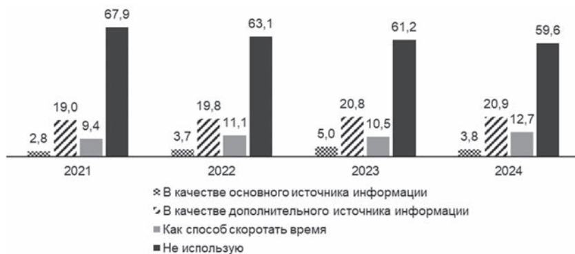
Рис. 1. Практики использования печатных СМИ населением Беларуси в 2021–2024 гг., %