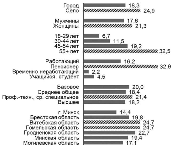
Рис. 3. Социально-демографический профиль читателей прессы, %

временно неработающих данная практика приобретения прессы в принципе отсутствует. Представители этой социально-демографической группы чаще предпочитают брать прессу у друзей, родственников или знакомых (26,7 %). В Интернете читают прессу преимущественно учащиеся и студенты (60,0 %).